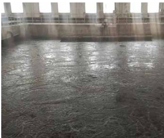
▲ 改造前 CAST 工艺