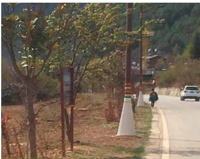
▲ 云南宁蒗泸沽湖环湖生态修复前