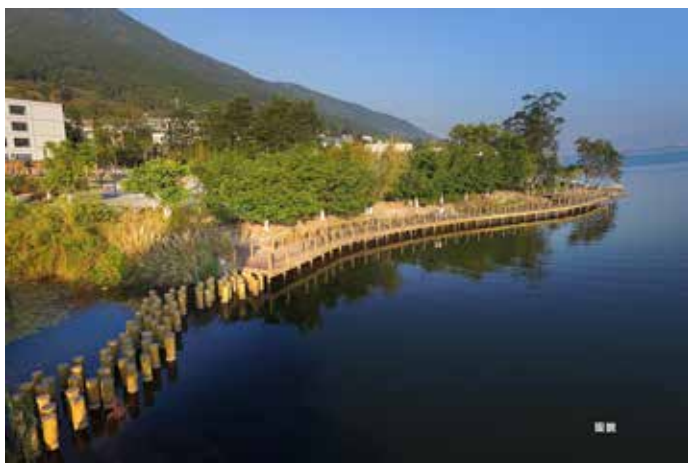
▲ 铁路技校一角改造后——西波鹤影湿地