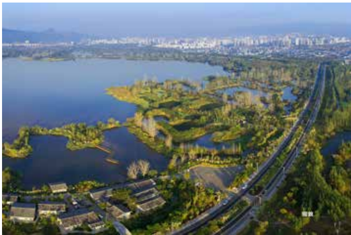
▲ 小渔村跑马场改造后——烟雨鹭洲

西昌市确立了“国际生态田园历史文化名城”的历史定位和长远目标，树立了“修复一片湿地，救活一个湖，造福一方百姓”的治理原则，实施立法保障、规划引领、生态搬迁、流域综合治理等措施，让城市发展与邛海生态保护协同共生。一是科学依法治湖。高标准编制《邛海流域环境规划》《邛海国家湿地公园总体规划》等数十项规划，形成了科学完整的保护、建设、利用规划体系。1997年4月颁布实施少数民族地区第一部生态环境保护的地方性法规《凉山州邛海保护条例》，为依法治湖和邛海生态环境保护提供