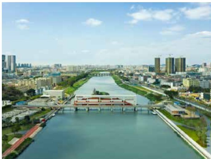
▲ 洋涌大桥段治理后