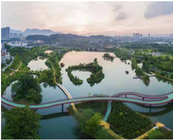
▲ 浦阳江翠湖段治理后

浦江率先打响了浙江省“五水共治”的第一枪，充分发挥党建优势，结合全民治水、依法治水、科学治水和长效治水，走出了一条“绿水青山就是金山银山”的发展新路。一是层层动员，全民治水。舆论先行形成治水共识，以一系列专题报道、评论凝聚社会合力，同时通过浦江道情、浦江乱弹等当地特色文艺形式进行宣讲，保障全民治水强大精神动力。党建引领，发挥基层党组织力量，党员干部冲锋在治水一线，并坚持每月 20 日环境卫生保洁日制度，呼吁全民参与