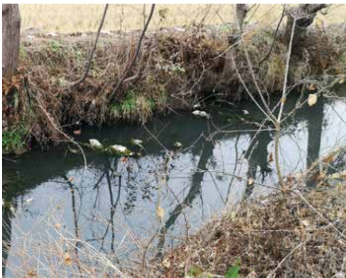
▲ 农村生活污水直排河流沟渠（治理前）

步建立特色鲜明的绿色产业体系，积极探索绿水青山向金山银山转化的有效路径。黄山市着力做好“茶”文章，推进茶叶种植生态化、加工清洁化改造，2021 年茶叶产值达 40 多亿元；着力做活“水”文章，山泉流水养鱼产业综合产值突破 7 亿元，实现了“草鱼变金鱼”，探索了山区精准脱贫新路子。