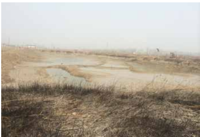
▲ 猪龙河三期治理前