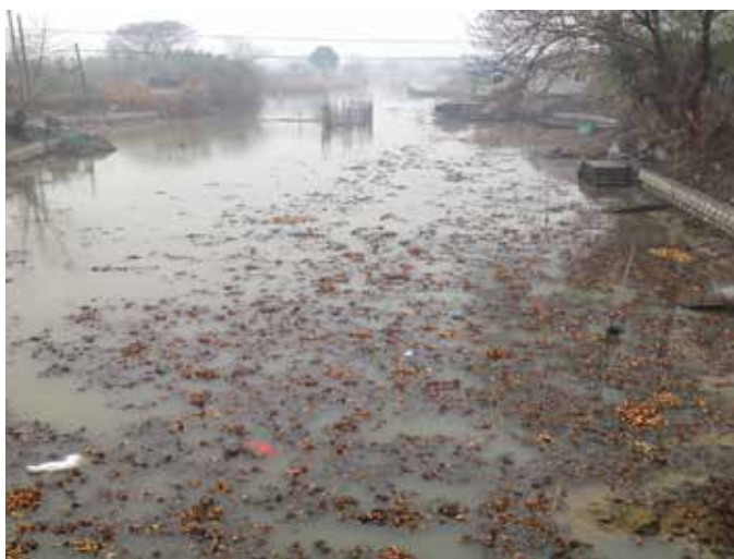
▲ 治理前——入湖支流南塘港