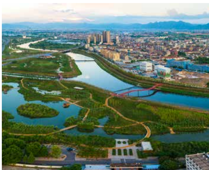
▲ 浦阳江三江口湿地治理后

浦阳江综合治理中充分发挥了党建优势，结合全民治水、依法治水、科学治水和长效治水，有效破解了经济社会和生态环境协调发展的难题，深入践行了“绿水青山就是金山银山”的发展新路。浦阳江模式可为在工业化和城市化过程中遭到重度污染的山溪型河流的治理提供思路和借鉴。