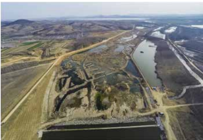
▲ 日照水库大桥 313 省道治理前

日照水库是日照市最重要的饮用水水源地，是日照市经济社会和生态环境的重要基石。由于统筹规划和系统治理不足、两山转化路径缺失、多元共治机制薄弱等原因，导致日照水库曾经存在一些难以突破的问题。一方面，水源保护形势严峻。2000-2009年，高锰酸盐指数和总磷等污染物浓度呈现升高趋势，全流域系统治理的理念尚未形成；水源涵养能力下降，日照水库周边森林覆盖率降低至12.4%，水土流失面积达到15.3km 2 ，水库水量减少。另一方面，尚未形成生态保护和产业开发的双赢循环，民生问题亟需得到有效解决。