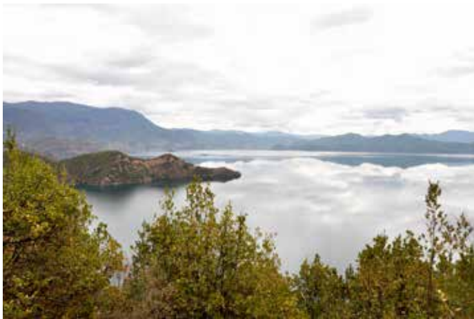
▲ 水天一色的云南宁蒗泸沽湖