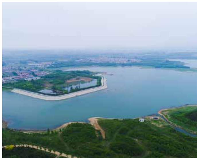
▲ 南湖镇西明照村区域治理后