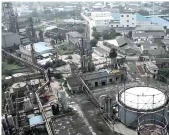
▲ 徽州循环经济园区治理前