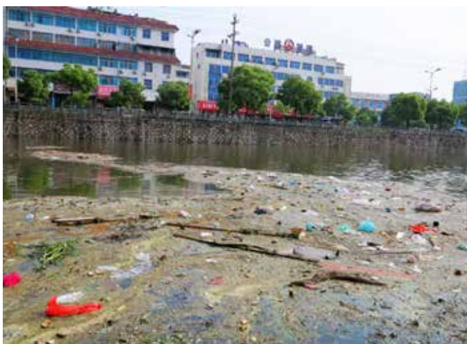
▲ 浦阳江（浦阳公路管理部门附近段）治理前