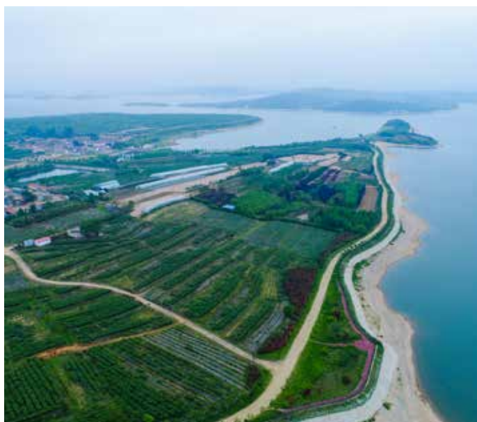
▲ 陈疇丁家沟村区域治理后