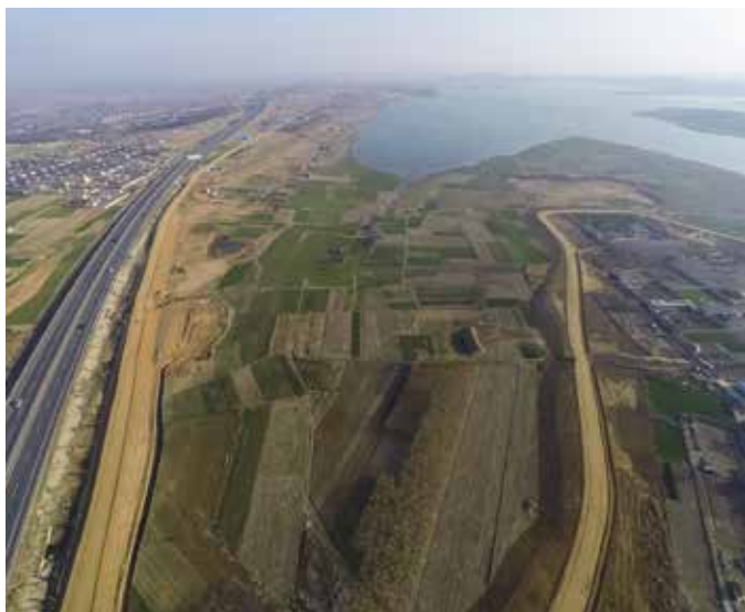
▲ 南湖镇庄头村区域治理前