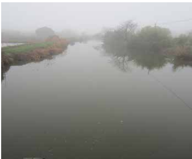
▲ 治理前——入湖支流东港