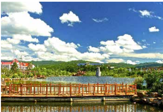
▲ 阿尔山市水上公园

2014年1月，习近平总书记视察阿尔山时指出“保护好生态就是发展”，阿尔山市秉持“生态立市”理念，按照“水源涵养恢复+河流廊道修复+环境综合整治+生态产业返哺”的思路，实施了一系列流域修复治理工程，不断促进流域生态价值转化。一是