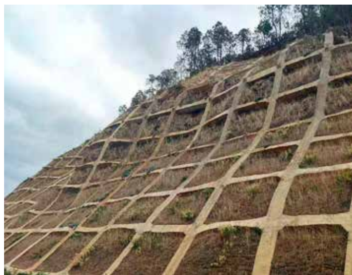
▲ 云南宁蒗泸沽湖边坡治理后