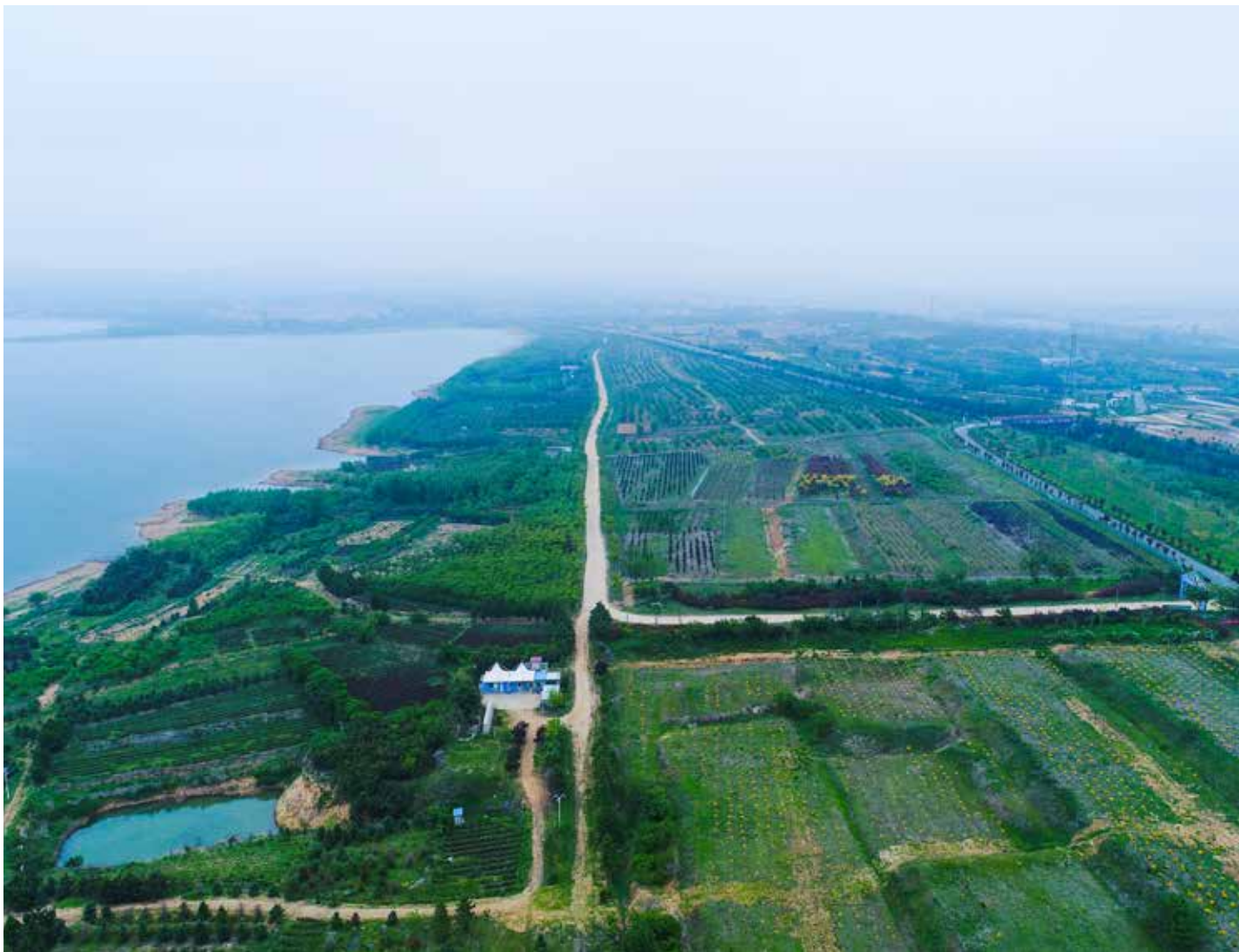
▲ 南湖镇许家庵村治理后

环库绿道 50 公里，构筑环库生态安全屏障。建设三库联通工程，实施农村饮水安全巩固提升三年行动，确保供水安全。二是坚持生态融合，推进“水源保护产业化”和“产业化推动水源治理”协同发展。以水资源、水环境承载力为基础，合理优化产业格局，确保产业建设规模适度、强度适中。以生态渔业、生态农业和生态旅游等特色产业运营为支撑，构建生态渔业 - 平台销售产业链，采用“六不用”模式发展生态农业，运行“旅游 + 文创”模式打造特色旅游产业链，实现生态效益、经济效益和社会效益的有机统一。三是坚持生态为民，构建保护日照水库的工作格局。以乡村振兴战略为引领，积极开展“绿色扶贫”行动。村民通过土地