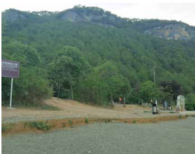
▲ 云南宁蒗泸沽湖情人滩生态修复前