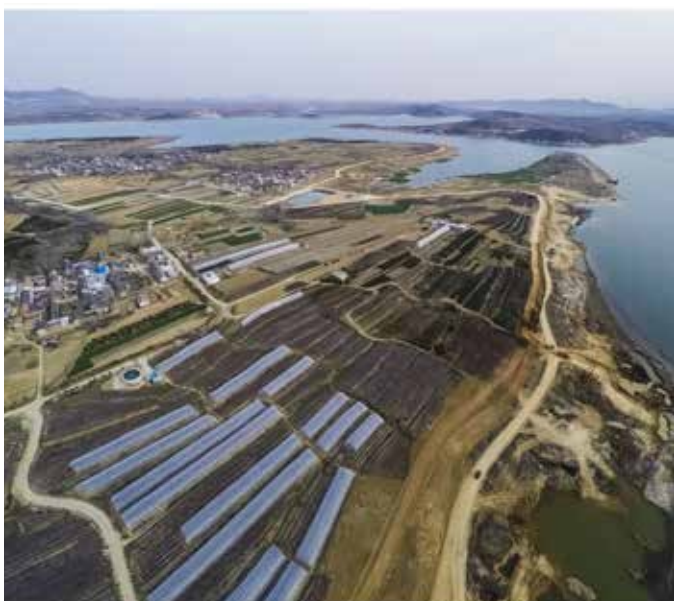
▲ 陈疇丁家沟村区域治理前