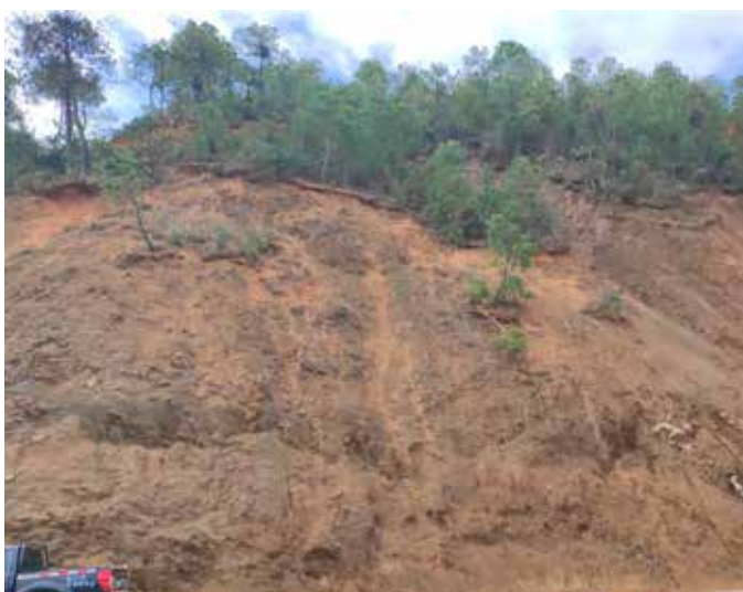
▲ 云南宁蒗泸沽湖边坡治理前