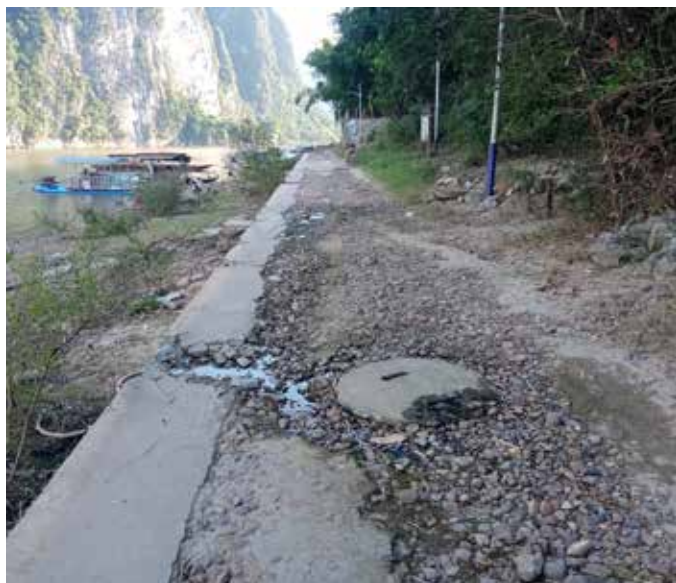
▲ 漓江 - 兴坪渔村渔业队岸线修复前

卫生差和产业无序发展，通过治本建立水生态环境保护长效机制，将流域水生态环境保护与产业发展、城市发展格局深度融合，实现生态环境、旅游发展、民生福祉的多方共赢，可为喀斯特地貌地区良好水体保护提供借鉴。