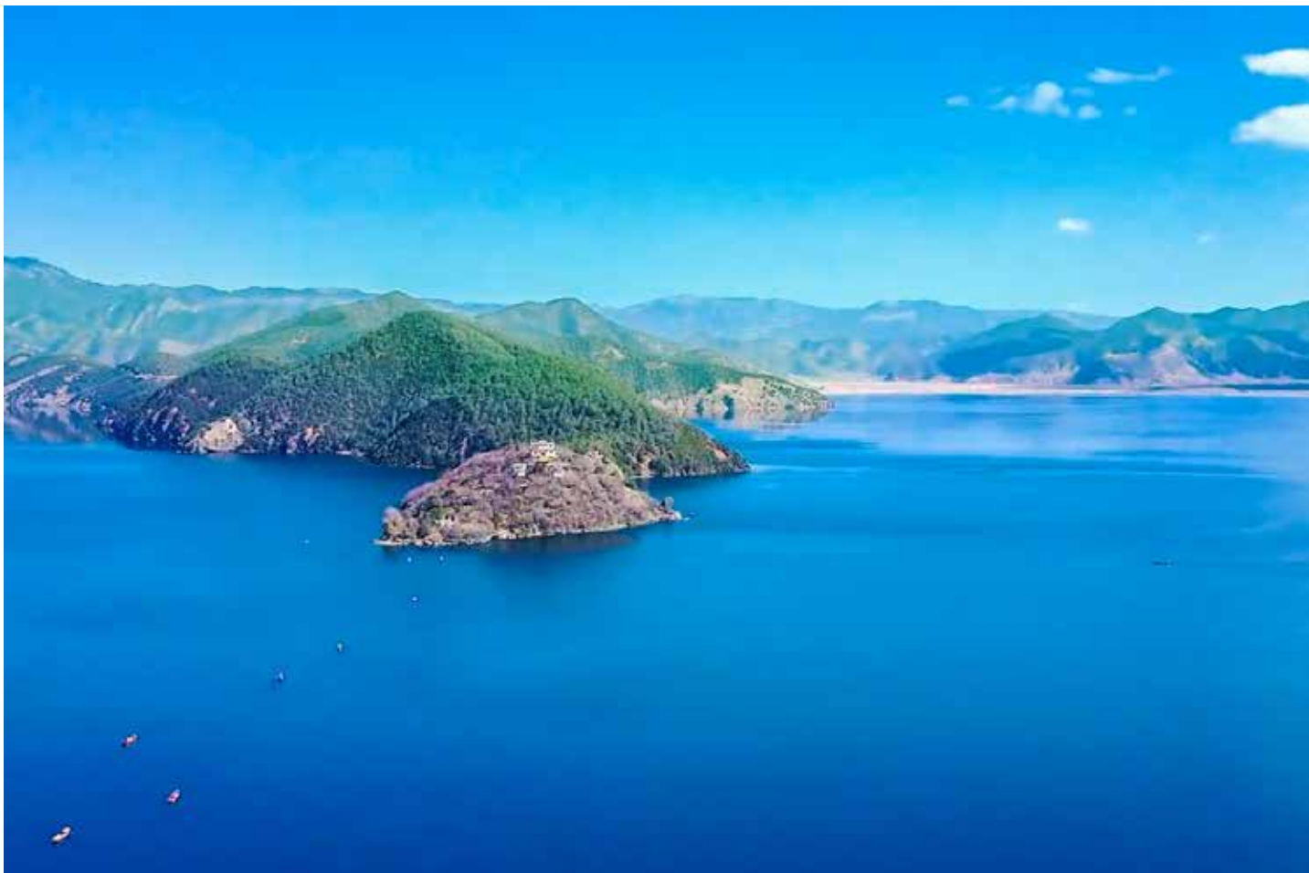
▲ 中午的云南宁蒗泸沽湖

监管不放松，建成泸沽湖水质自动监测站和环保所，完成泸沽湖智慧环保信息化工程的主要建设内容；坚持点源、面源污染治理不停顿，实施了生态修复和湖滨生态带建设，流转湖滨 1122 亩土地和水源地 1540 亩林地、1345 亩土地，实施土地休耕和生态修复，对 5 条主要入湖河道进行系统治理，确保入湖水质达标。四是“推进由注重当前向长治长管转变”，强化准入制度，实施禁止以文旅、康养名义开发房地产，禁止不符合生态功能区的各类开发活动及不准燃油、机动、金属船只入湖活动，禁止在湖中捕鱼等“十严禁”制度；创新管理服务机制，采用社会化购买服务方式，引进第三方企业规范化开展污水处理和环卫服务，提升服务能力；健全问题整改机制，坚持问题导向，全面整改中央环保督察“回