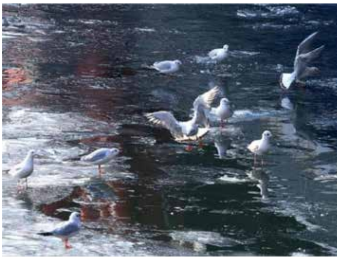
▲ 治理后水质清澈，海鸥翱翔