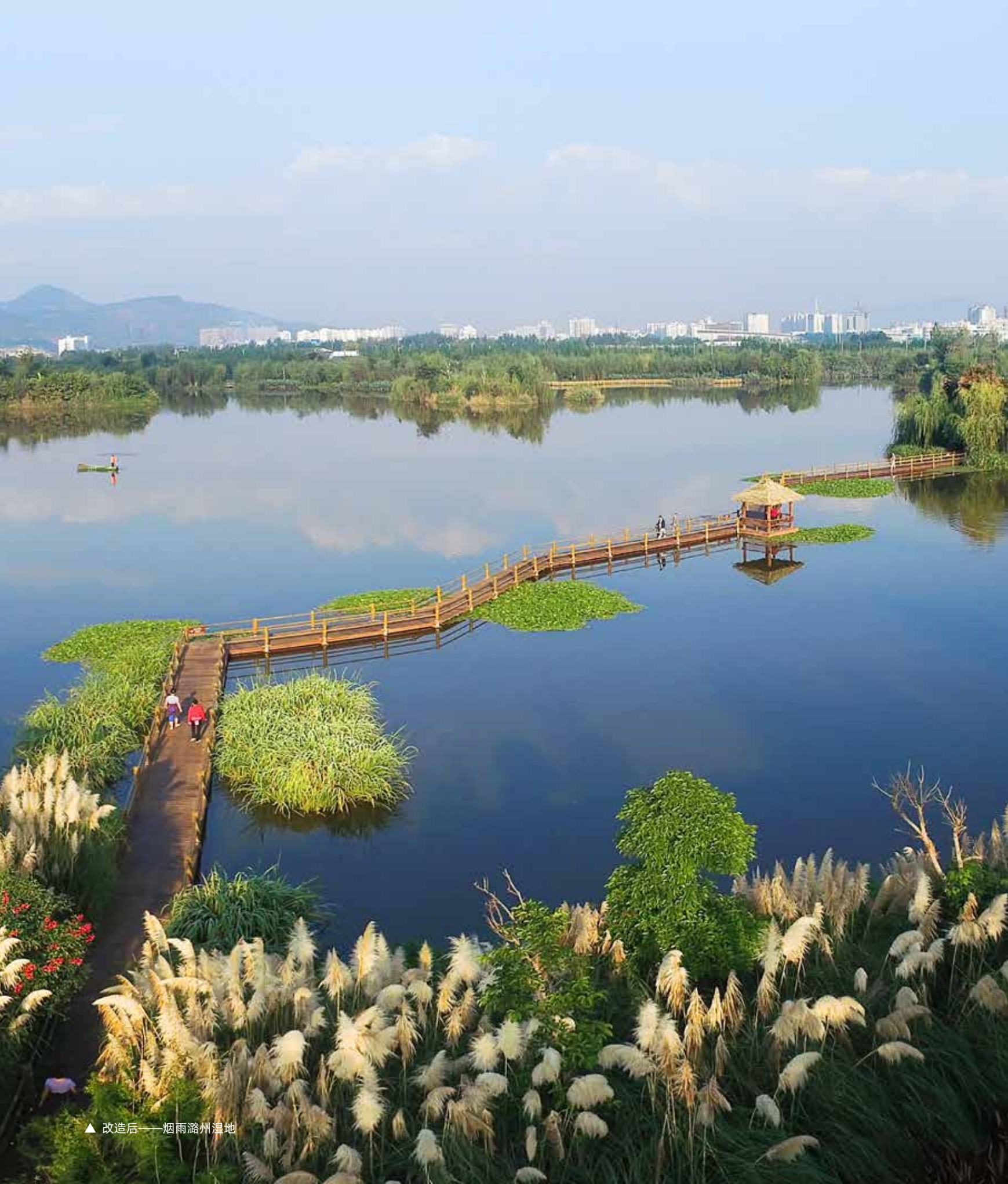
▲ 改造后——烟雨潞州湿地