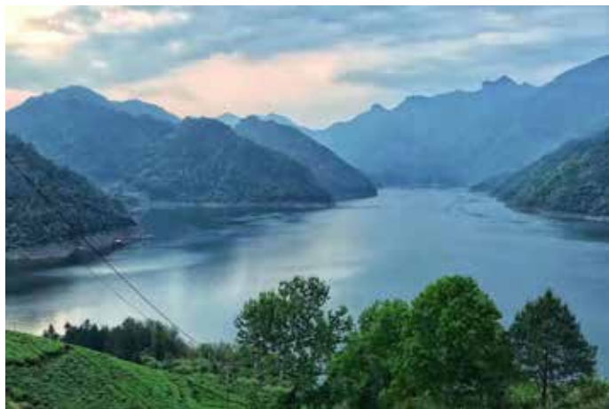
▲ 洪口水库渔港码头治理后