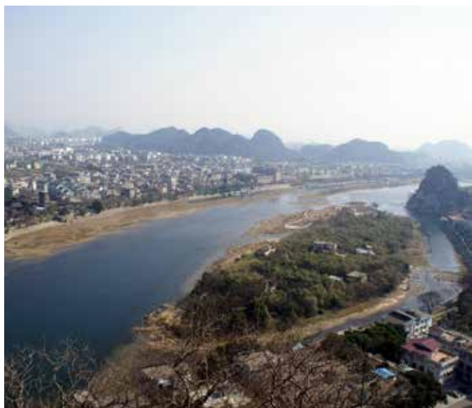
▲ 漓江上小岛伏龙洲生态修复前