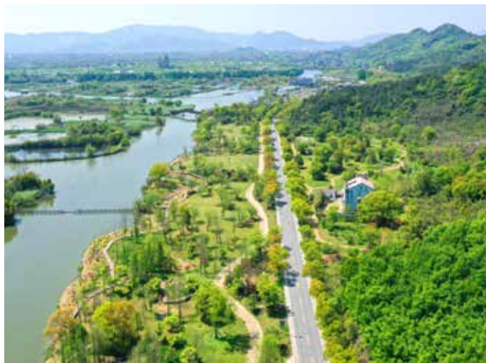
▲ 治理后——山地皇（105 户农户整体拆迁）