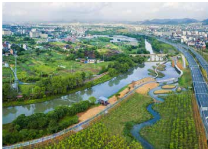
▲ 浦阳江湖山桥治理后