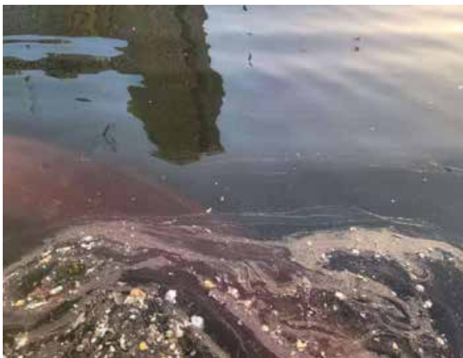
▲ 治理前金刚桥下垃圾积累

海河对天津具有重要意义，河北区段作为海河上最耀眼的明珠，大悲禅院、望海楼教堂、奥匈帝国领事馆旧址、李叔同故居、冯国璋旧居、袁氏宅邸、意大利风情区均沿河而建，与摩天轮等