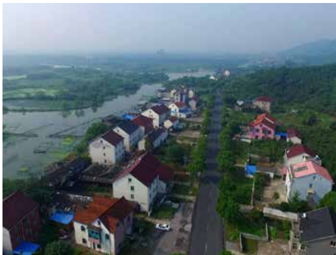
▲ 治理前——山地皇（105 户农户整体拆迁）

III 类水，800 多种动植物在这此繁衍生息，鸟类中的“东方宝石”朱鹮，在下渚湖野外自然繁衍，先后被命名为朱鹮易地保护暨浙江种群重建基地、国家级野大豆原生境保护点，并获评“中国最美湿地”称号。得益于良好的水生态和生态养殖模式，有“中国青虾之乡”美誉的下渚湖，建立了“好水育好虾”的“水精灵”青虾品牌，成为了村民致富增收的主要增长点。