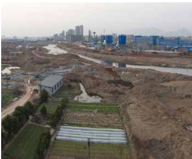
▲ 浦阳江三江口湿地治理前

治水后，浦阳江水质从连续 8 年劣 V 类提升至 III 类，连续 7 年夺得浙江省治水“大禹鼎”，生态环境质量群众满意度从全省倒数第一跃升至全省前五。浦江“绿色崛起模式”入选浙江乡村振兴十大模式，葡萄、香榧、高山蔬菜等特色农产品享誉省内外，带动全县农民增收致富。