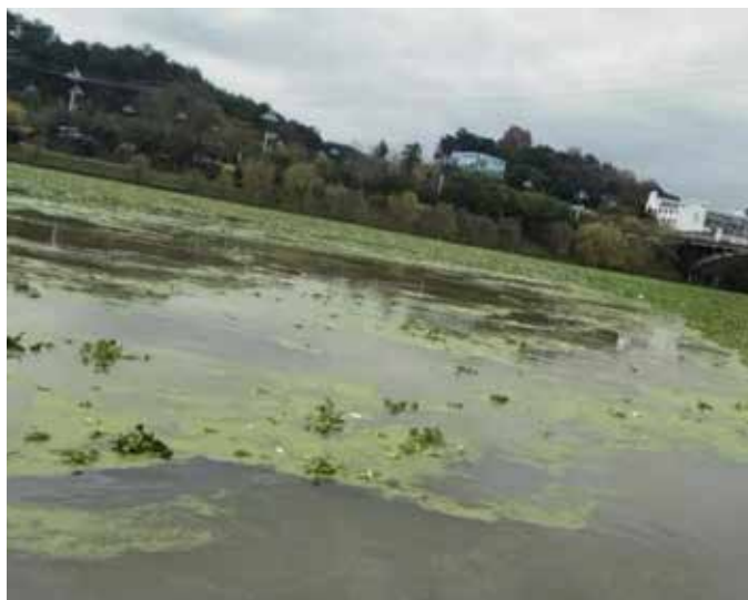
▲ 新安江横江段治理前