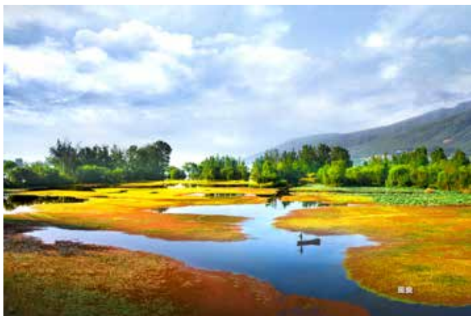
▲ 老海亭围海造田改造后——梦里水乡湿地