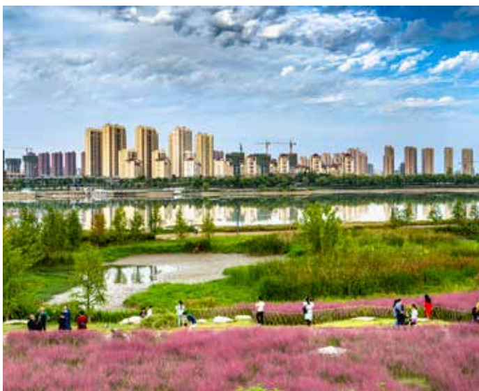
▲ 现龙岗大桥广场南岸上游

近年来，汉中市委、市政府坚决扛牢“一泓清水永续北上”政治责任，持续加大生态环境保护投入力度，不断强化制度建设、法制保障和刚性约束，确保汉江出境水质持续保持Ⅱ类以上。一是 建立完善机制体制 。成立市生态环境保护委员会和秦巴生态环境保护委员会，严格落实河湖长制，完善“河湖长统筹、责任单位落实、河湖警长执法、检察长协作、水政执法人员巡查、河长