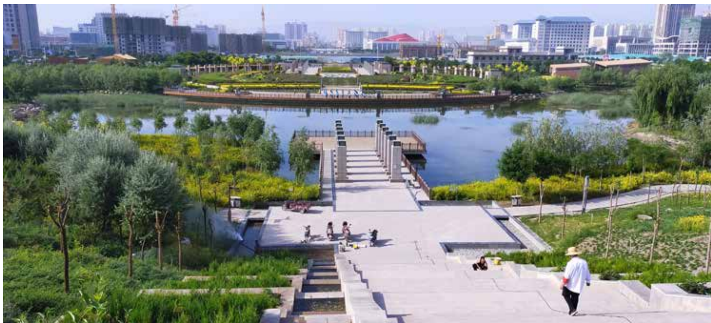
▲ 海藏河生态治理—海藏湿地公园打造集河道治理、防洪减灾、休闲健身、观光娱乐为一体的生态景观。

与民勤县签订了《石羊河流域上下游横向生态补偿协议》,建立健全了地表水生态补偿机制。 三是创新治理模式。 针对流域干旱脆弱的生态特性,创新河流生态功能区划与治理模式,将石羊河划分为城市亲水宜居—生物多样性保护区、生态环境控制区、尾间生态恢复区等3个水生态功能区,分段施策,达到“人水和谐”。 四是夯实基础工作。 加快基础设施建设,在全省率先实现城市及