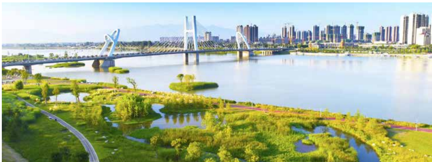
▲ 汉江（龙岗大桥段）裸露河滨带治理后