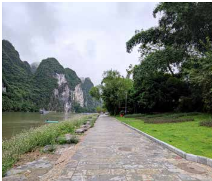
▲ 漓江 - 兴坪渔村渔业队岸线修复后