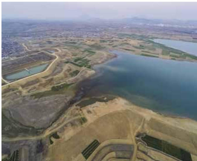
▲ 南湖镇西明照村区域治理前

转化步入正轨，政府引导、企业主导、社会参与的多元共治格局基本形成。三是公众获得感、幸福感明显提升，稳定实现“人水和谐”。经济社会和生态环境协调发展，优质丰富的生态产品持续造福群众。日照市、东港区荣获“联合国人居奖城市”“国家生态保护与建设典型示范区”“国家级可持续发展试验区”“国家生态文明建设示范区”等一系列金字招牌，“以人为本、生态优先”的绿色发展理念得以实现。