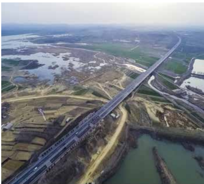
▲ 日兰高速日照水库大桥治理前