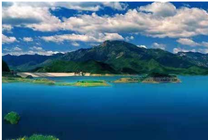
▲ 密云水库 2