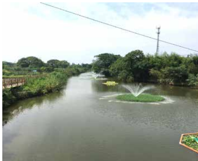
▲ 治理后——入湖支流东港