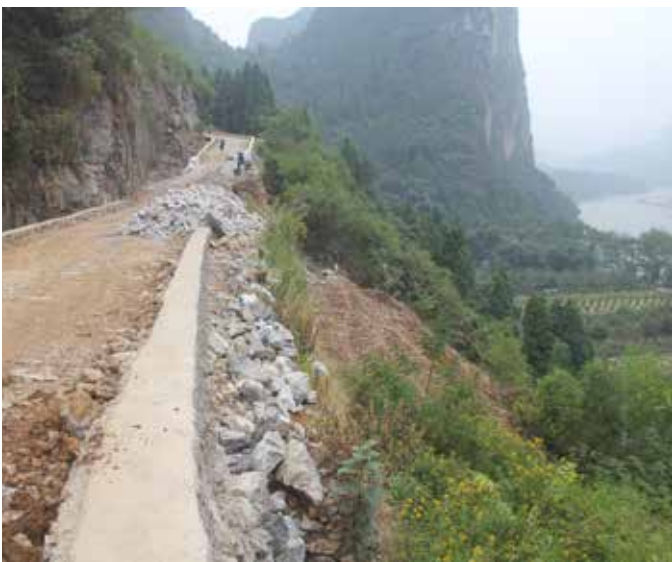
▲ 漓江 - 阳朔浪石村道路工程生态修复点修复前

漓江流域是世界上规模最大的岩溶山水区，是桂林人民的“母亲河”，也是桂林山水的“魂”。过去漓江沿岸存在乱建、乱挖、乱养、乱经营的现象，青狮潭水库、漓江干流城市段、桃花江等水域网箱养殖问题突出，漓江干流游览排筏高达 5000 余张，老旧小区、城中村、老旧城区和城乡结合部基础设施建设滞后，道光河、灵剑溪、南溪河等河流出现黑臭，漓江水生态环境受到严重破坏。