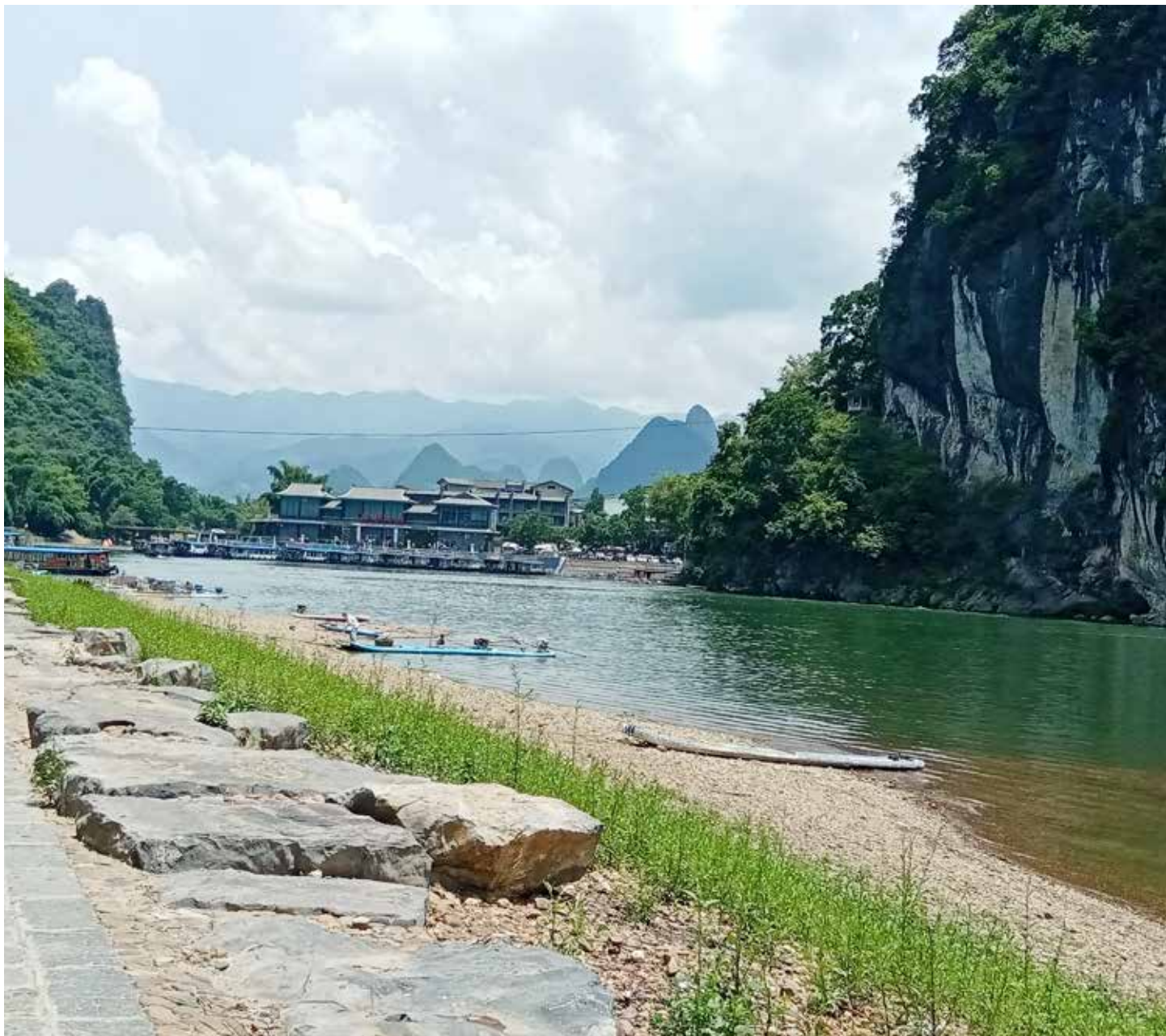
▲ 漓江 - 兴坪渔村渔业队岸线修复后

经过治理，桂林城市污水集中收集处理水平大幅度提升，森林覆盖率增至 71.9%，漓江干流水质稳定达到 II 类。2021 年“桂林市全力促进漓江流域生态环境持续向好”的典型经验做法由国务院办公厅给予通报表扬。