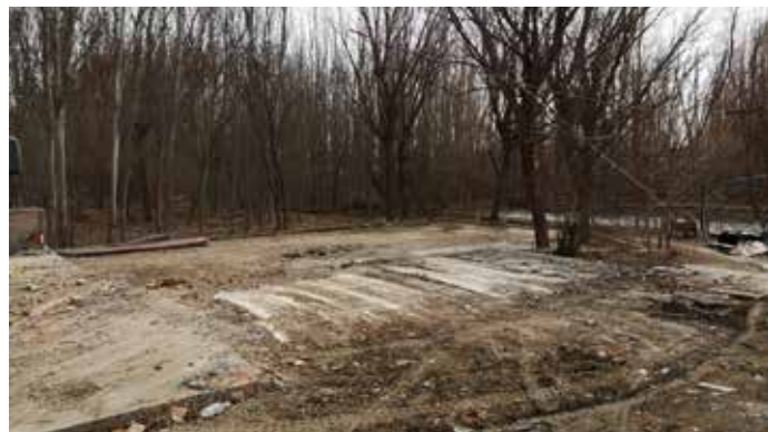
▲ “五一休闲”农家乐拆除后