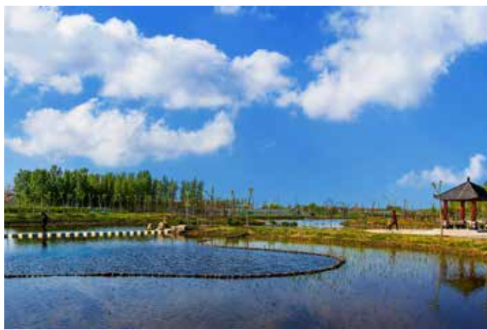
▲ 猪龙河三期治理后