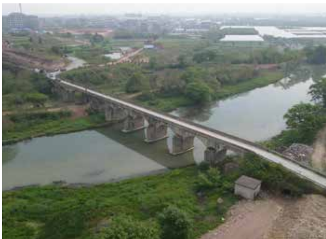
▲ 浦阳江湖山桥治理前