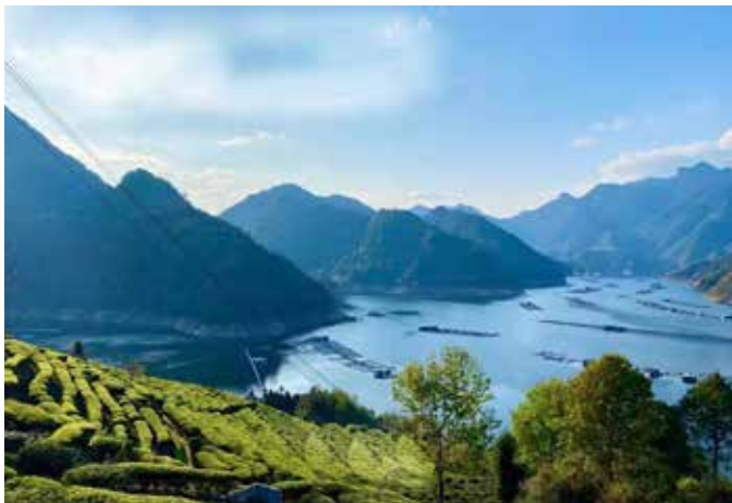
▲ 洪口水库渔港码头治理前

金山银山”的理念，采取“高位补短板、精准建长效、特色促发展”的霍童河流域链式保护措施，统筹推进水环境、水资源、水生态、水文化、水管理“五位一体”，着力将霍童河流域打造成为安全、健康、美丽、繁荣的幸福河。（一）“高位补短板”，大手笔谋划破题补齐短板。一是立法编规，制定实施地方性法规《宁德市霍童河流域保护条例》，制定全省首个单流域规划《霍童流域生态环境保护规划（2020-2025年）》，并与国家生态文明建设示范市县建设、国家重点生态功能区建设等10余个专项规划做了相互衔接。二是选优淘劣，坚决从空间管控、产业准入入手，坚决清退高污染、高能耗的化工、造纸以及水泥等行业，并积极引进对环境更