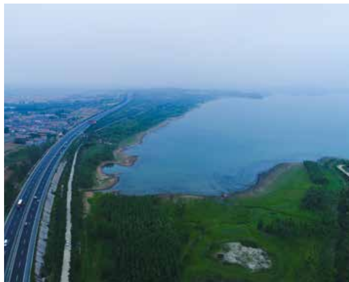
▲ 南湖镇庄头村区域治理后