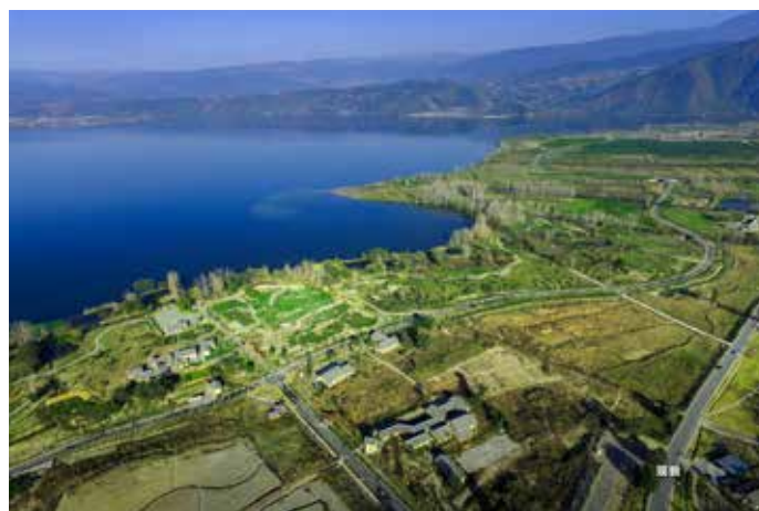
▲ 古城村改造后——梦回田园湿地