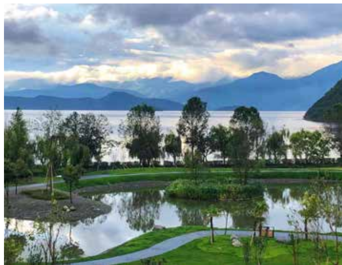
▲ 云南宁蒗泸沽湖里格生态修复后