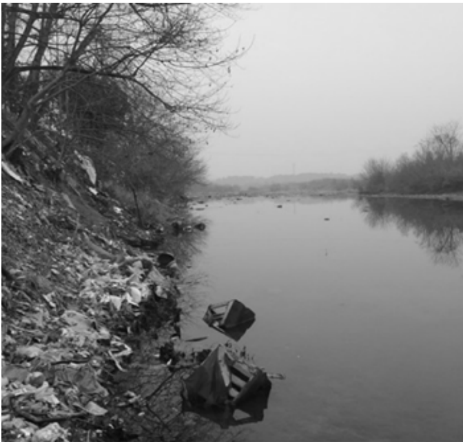
▲ 新安江丰乐河治理前

新安江发源于安徽黄山，平均出境水量占下游浙江千岛湖入库水量的 68% 以上。本世纪初，黄山进入工业化、城镇化加速发展的阶段，大量污水和垃圾通过新安江进入千岛湖，2010 年左右水质富营养化趋势明显，流域生态安全面临严峻挑战。