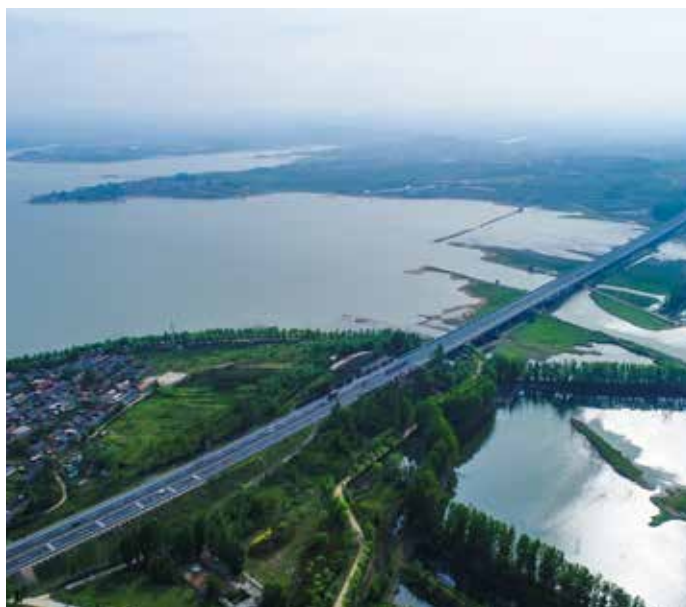
▲ 日兰高速日照水库大桥治理后