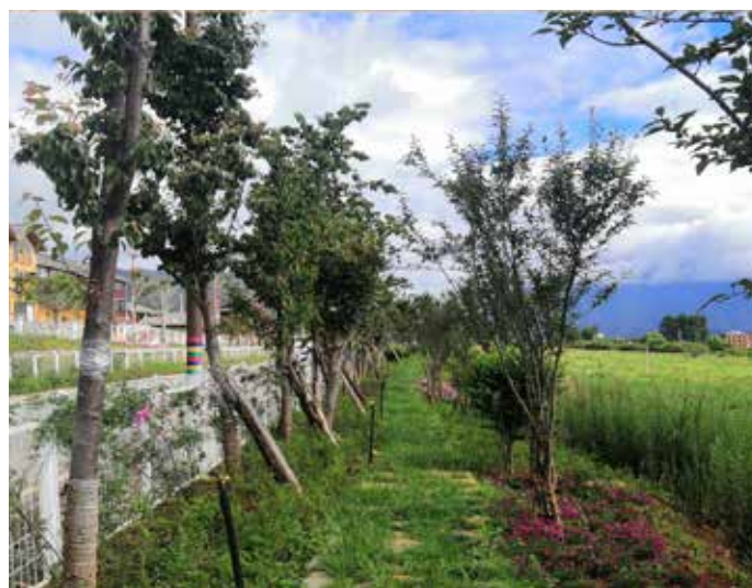
▲ 云南宁蒗泸沽湖环湖生态修复后

整合行政执法资源，构建“综合执法+综合执法+社区协管”格局，不断提升景区的综合管理和服务能力；坚持全民参与共同保护，广泛开展主题党日、“清水净湖”“小手拉大手、共护母亲湖”宣传教育活动和集中销毁违规渔具行动，生态保护意识逐步深入人心，保护母亲湖成为全民共识和自觉行动。