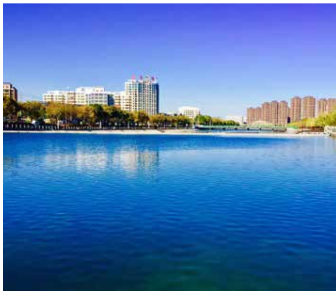
▲ 天马湖工程治理—呈现蓝天碧水

武威市坚持把推行河湖长制作为落实绿色发展理念、推进生态文明建设的重大举措。围绕保护水资源、防治水污染、改善水环境、修复水生态等主要任务，精准施策，全面推进河湖治理保护工作。一是健全机制制度体系。全面推行“河湖长+检察长+警长”工作机制，建立完善河长巡河、工作督察等17项制度，形成“总河长率先抓、各级河长具体抓、水务部门牵头抓、责任