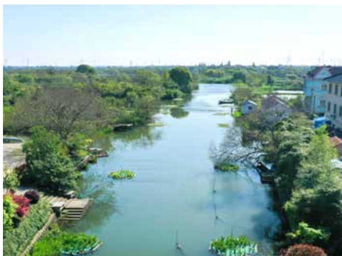
▲ 治理后——入湖支流南塘港