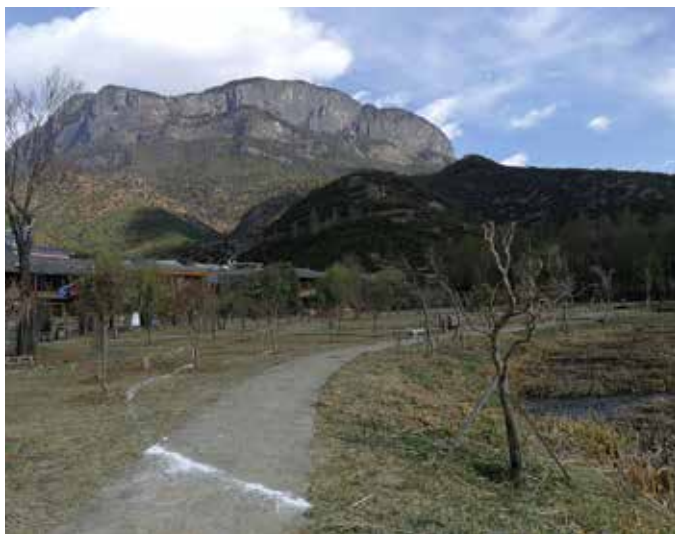
▲ 云南宁蒗泸沽湖里格生态修复前

泸沽湖严格把牢生态保护“红线”，坚决守住环境安全“底线”，采取“五推进、五转变”的治理措施，一手抓保护、一手抓发展，对山、水、林、田、湖、草、沙进行系统有效治理的“泸沽湖模式”，可为处于自然保护区、风景名胜区的河湖在保护好生态环境的前提下促进地方经济发展，实现绿水青山向金山银山的转换提供经验借鉴。