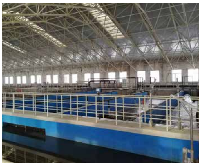
▲ 改造后 MSBR+ 深度处理工艺