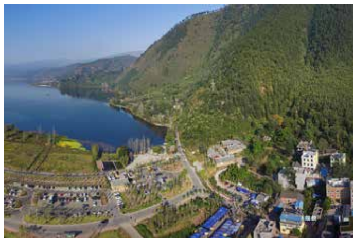
▲ 核桃山脚改造后——梦回田园湿地

强力保障。 二是实施生态搬迁。 投入资金 50 多亿元，实施退塘还湖、退田还湖、退房还湖的“三退三还”工程，生态搬迁邛海周边群众 5 万余人，建成 2 万亩湖滨带湿地，恢复湖泊湿地和湖滨带 1067 公顷。 三是强化控源截污。 建成日处理 2 万吨的邛海污水处理厂，配套管网 56.1 公里，新建“四乡一镇”主管网 51.3 公里，入户管网 44.2 公里，污水处理站 6 座。 四是加强生态保护修复。 实施邛海周边天然林资源保护、人工造林、退耕还林、生态修复等工程。截至目前封山育林面积 6.2 万亩，人工造林 11.82 万亩。实施流域泥沙治理工程，加强官坝河、鹅掌河、小箐河等小流域泥沙治理，减少水土