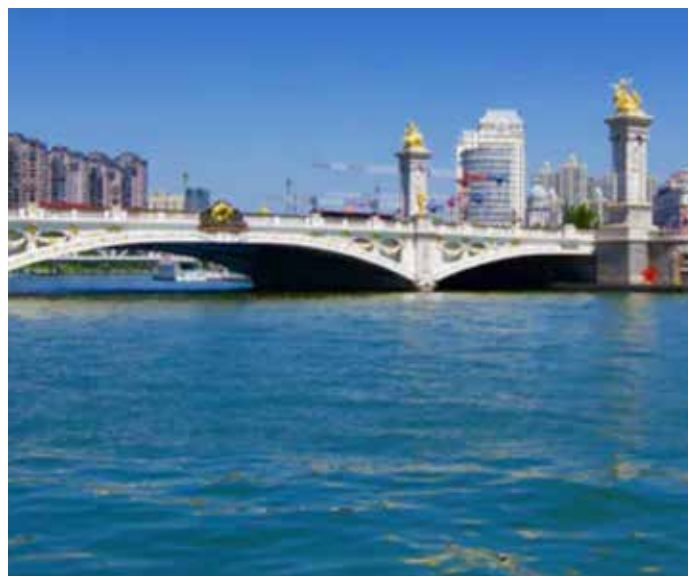
▲ 如今北安桥下波光倒影，水体清澈