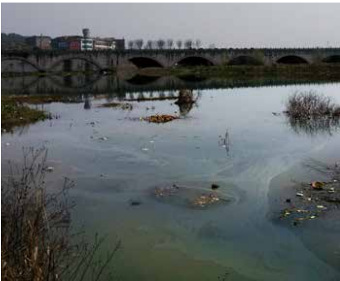
▲ 浦阳江翠湖段治理前

浦阳江是钱塘江的重要支流之一，属于典型的山溪型河流，流域面积 518 平方公里，浦江县 80% 以上的居民依江生产和生活。上世纪八十年代，水晶产业无序发展，2.2 万多家水晶加工作坊每天约有 1.3 万吨水晶废水、600 吨水晶废渣直排环境。全县 577 条大小河流全是垃圾河，牛奶河、黑臭河占 80%，浦阳江出境断面水质连续 8 年劣 V 类，粗放的经济发展和生态环境保护的矛盾十分突出。