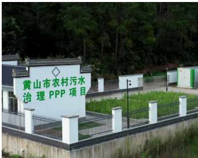
▲ 农村生活污水直排河流沟渠（治理后）