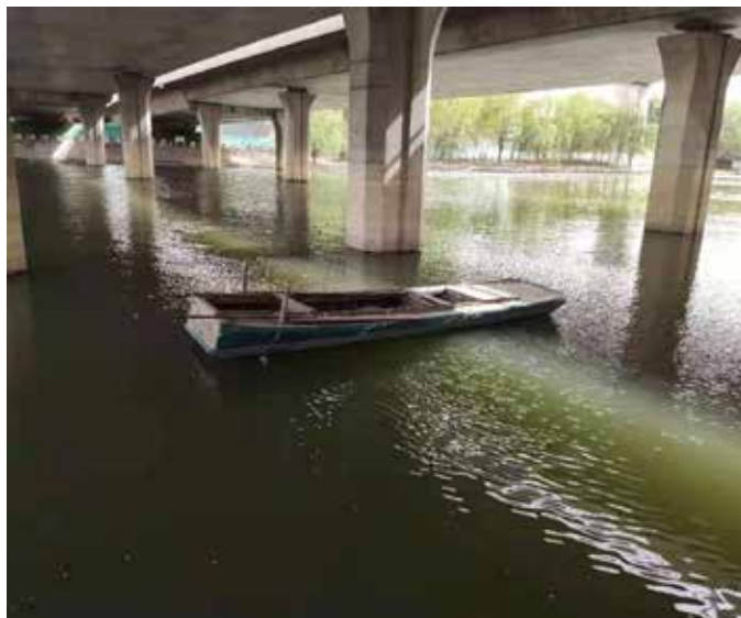
▲ 治理前偷捕的渔船