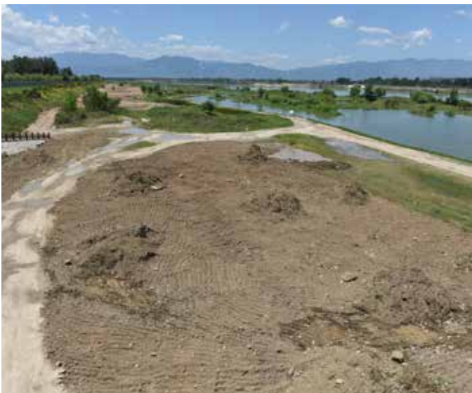
▲ 原龙岗大桥广场南岸上游

汉中位于陕西省西南部，地处秦巴山区西段，北靠秦岭、南倚米仓山（即大巴山西段），属经济欠发达地区，财政收入低，生态环境保护基础设施建设不足，同时，作为国家南水北调中线工程和陕西省引汉济渭工程重要水源涵养区，环境准入门槛高，环境风险防范任务艰巨，协同推动生态环保与经济发展压力大，保护汉江（汉中段）水质稳定优良面临严峻挑战。