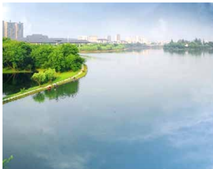
▲ 新安江屯溪段治理后

首个跨省生态保护补偿试点在新安江流域启动实施。皖浙两省制定并出台《新安江流域水环境补偿试点实施方案》《关于加快建立流域上下游横向生态保护补偿机制的指导意见》等政策文件，统一思想理念，明确细化责任，突出新安江水质改善结果导向，为试点的高效实施和整体推进提供了政策保障。二是 加强流域上下游共建共享，打造合作共治平台 。共编规划，强化精准保护；共设点位，强化信息共享；共建平台，强化保护合作；共谋合作，强化区域协同