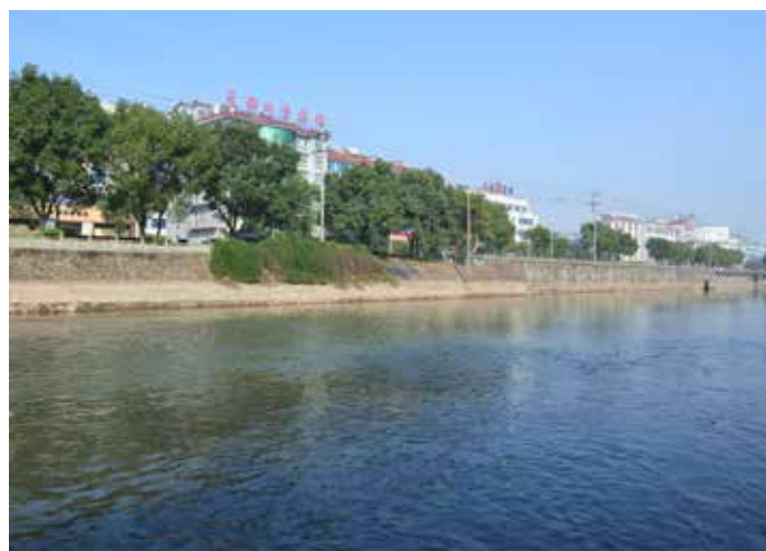
▲ 浦阳江（浦阳公路管理部门附近段）治理后

共同护水。二是法治先行，依法治水。大力推进污染整治，关停水晶加工作坊 2.2 万余家，关停禁养区内养殖场 775 家，关停并转印染、造纸、电镀企业 23 家。以“拆违治污”为突破口，将违法建筑治理与治水工作紧密结合，累计拆除各类违法建筑 670 余万平方米。三是快速高效，科学治水。通过四大行动、两项整治，将治理后的水晶企业集中到四个工业园区，实现“园区集聚、统一治污、产业提升”的目标。搭建数字治水网络，建设智慧排水系统、智慧水利系统、生态环境数智指挥系统，为科学决策提供辅助依据。创新实施“一厂一