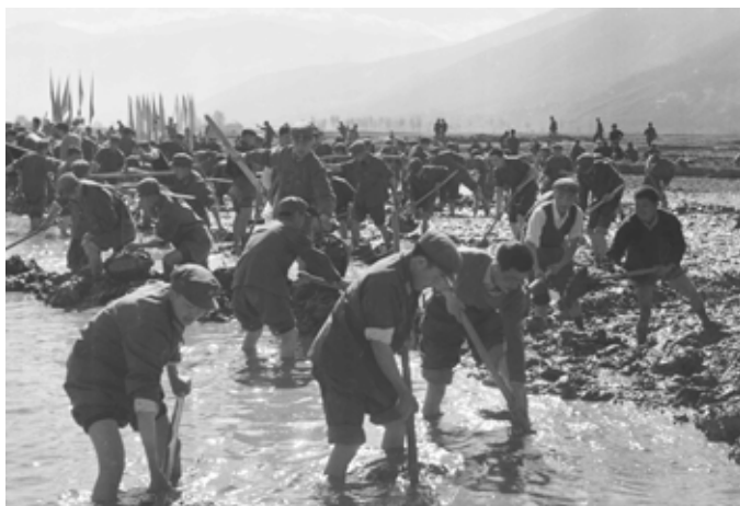
▲ 老海亭前围海造田（1975）