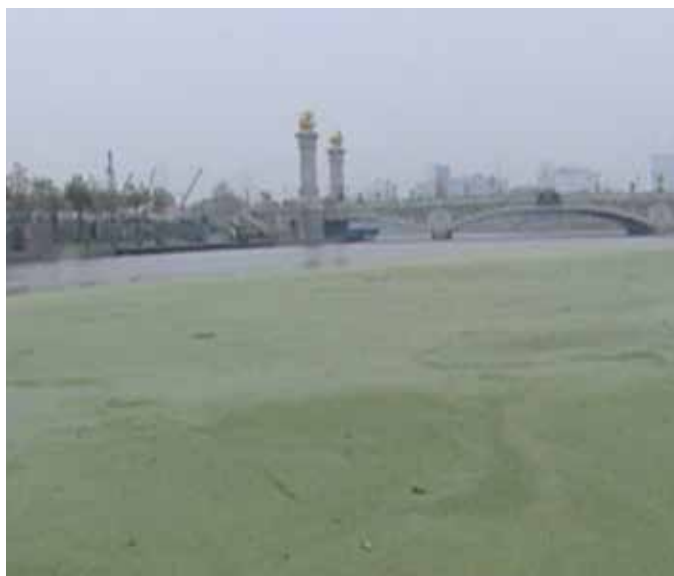
▲ 曾经的海河北安桥下铺满浮萍、水体浑浊