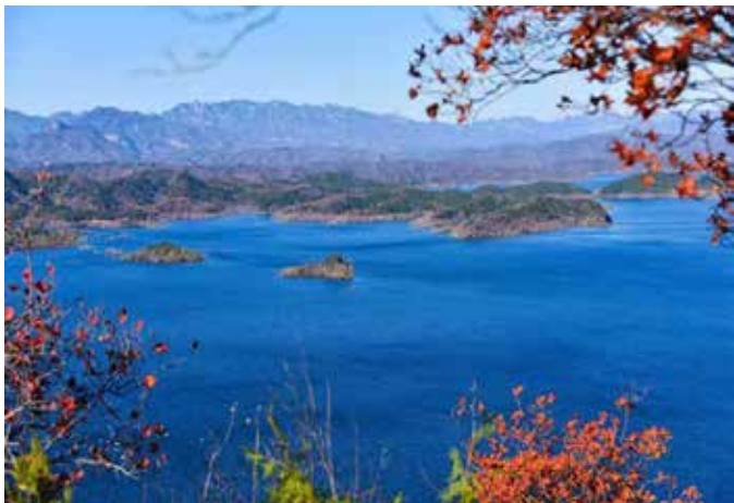
▲ 密云水库 1

这一盆净水，密云区始终将保水作为重中之重，坚持河湖统领，深化生态文明建设，改革创新，全方位保护首都生命之水。 一是创新体制机制，构建保水新格局。 全面加强党的领导，成立市委生态文明建设委员会，下设水污染综合治理工作小组。密云区成立区委生态文明建设委及水小组、区纪委监委首都水源保护监督工作专班，以政治监督助力生态环境保护工作。在全国率先实现特定区域综合性执法，打破市区界限和部门界限，集中统筹行使 131 项涉水执法权，解决了多头执法、重复执法问题。建立区、镇、村三级保水体系，对库区实现全方位、全天候看护。 二是实施水源保护工程，清洁库区环境。 实施“退耕禁种、养殖退养、库中岛修复、矿山退出、