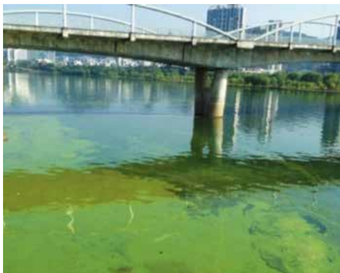
▲ 新安江屯溪段治理前