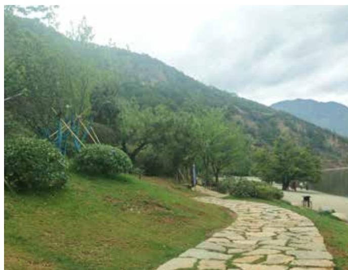
▲ 云南宁蒗泸沽湖情人滩生态修复后