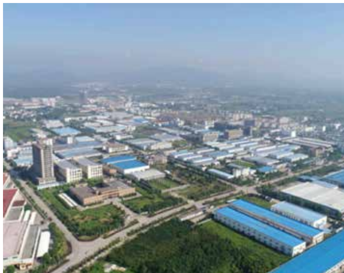
▲ 徽州循环经济园区治理后