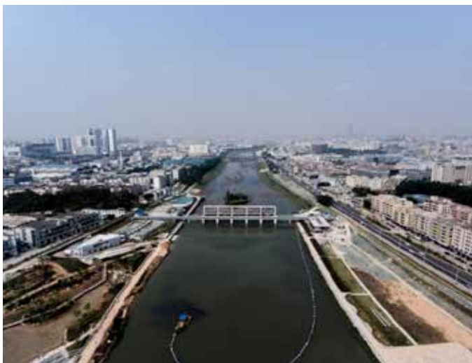
▲ 洋涌大桥段治理前

和村国控断面氨氮由 2015 年的 23.3 毫克 / 升下降至 2020 年的 1.15 毫克 / 升，实现从重度黑臭到地表水 IV 类的跨越；渚清沙白、水草丰美，白鹭翔集成为茅洲河今天的写照，消失多年的当地螺、蓝尾虾、黑鱼和彩色蜻蜓重回茅洲河，国家濒危植物野生水蕨首次在流域内发现，流域水生生物多样性明显提高；停办多年的龙舟赛重新开赛，外迁 26 年的深圳船艇队终于“回家”，沿河生态长廊人流如织，小区居民自发挂出了“绿水青山就是金山银山”的大条幅。茅洲河不仅治出了秀水美景，更治出了百姓口碑。