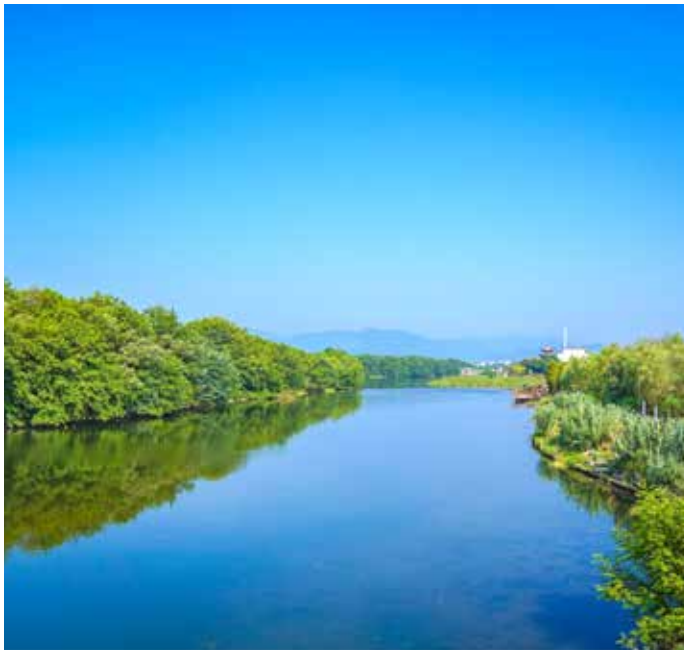
▲ 新安江丰乐河治理后

为保护新安江流域水生态环境，皖浙两省高位推动，以生态保护补偿机制为抓手，把保护流域生态环境作为首要任务，积极推进流域上下游协同共治，探索了绿水青山向金山银山转化的有效路径。一是建立权责清晰的流域横向补偿机制框架。2012 年，全国