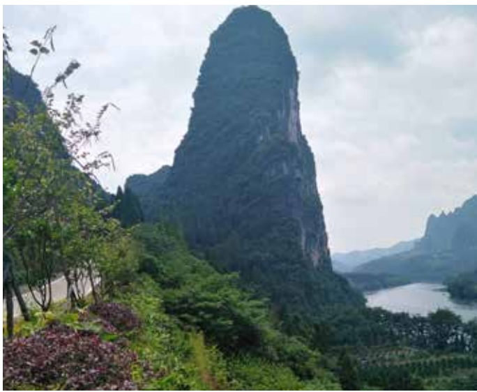
▲ 漓江 - 阳朔浪石村道路工程生态修复点修复后

为全面提升漓江流域水生态环境，桂林市深入贯彻习近平总书记关于广西工作和桂林发展的重要指示精神，积极践行“绿水青山就是金山银山”理念，坚持山水林田湖草系统治理，因地制宜开展“治乱、治水、治山、治本”。在“治乱”上聚合力，重拳治理漓江沿岸“乱建、乱挖、乱养、乱经营、环境卫生脏”等“四乱一脏”现象。开展“清四乱”专项行动，排查核实河湖“四乱”问题 90 个，核对卫星遥感发现的疑似“四乱”线索 174 条，