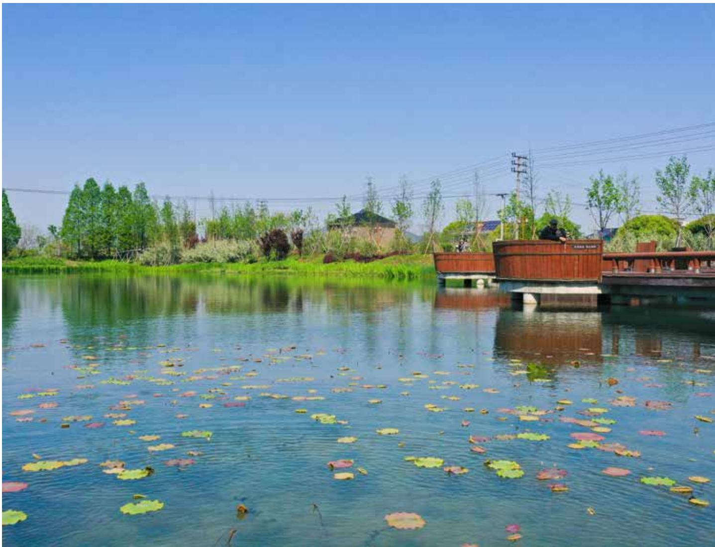
▲ 改造后——塘家琪小微水体

河流进行治理，全面提升湿地防洪能力。 三是综合治理。 湿地红线外的青虾养殖是当地农户主要收入来源，为做到产业绿色发展，创新了“四池三 / 二坝式”水产养殖尾水治理模式，实现了渔业养殖尾水治理全域覆盖，形成了一套可复制、可推广的尾水治理和渔业转型经验。同时，在提升农村生活污水治理上，推行“一根管子接到底”的“五位一体”农村生活污水治理模式；在提升环卫保洁水平上，建立了“一把扫帚扫到底”的城乡环卫一体化管理模式。 四是生态修复。 在做好源头治理的基础上，不断推进水生态修复，利用“水下森林”模式的水生态修复技术，建立了