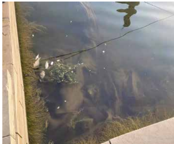
▲ 治理前偷捕的地笼

并投资 0.96 亿元开展绿化提升改造、水生态保护。完成全区所有加油站共计 66 个储油罐体改造，杜绝地下水污染。 三是狠抓扩容关。 作为全国最缺水的城市之一，按照“节水优先”的治水理念，2020 年，入选了国家第三批节水型社会建设达标区。强化再生水源利用，完成提标改造建成亚洲最大的半地下式的东郊污水处理厂，提标后的出水达到 IV 类水体标准，每天 60 万吨出水补充到