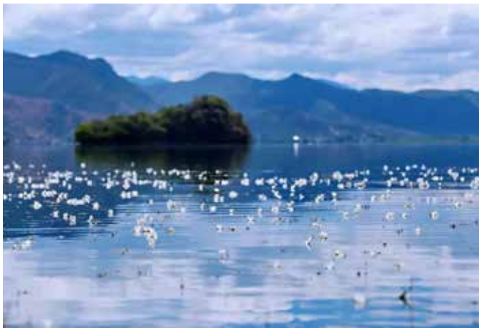
▲ 春天的云南宁蒗泸沽湖

好水污染防治攻坚战。一是“推进由行政管理向依法治理转变”，出台《丽江市泸沽湖保护条例》及实施细则、《云南泸沽湖保护治理规划》《丽江市宁蒗县泸沽湖流域控制性环境总体规划》《云南泸沽湖省级自然保护区总体规划》等一批保护性规划，统筹各类规划，编制《云南省泸沽湖流域国土空间保护和科学利用专项规划》，实现一张蓝图管到底。二是“推进由围湖发展向控湖转坝转变”，实施“一带、一路、三镇、四配套”项目，逐步将旅游接待重心向流域外转移。三是“推进由单一治理向系统治理转变”，坚决整治“两违”、实施一级保护区内原住居民生态搬迁工程有效腾退河湖岸线生态空间，全面改善河湖面貌，实现了“人退湖进”；实施智慧