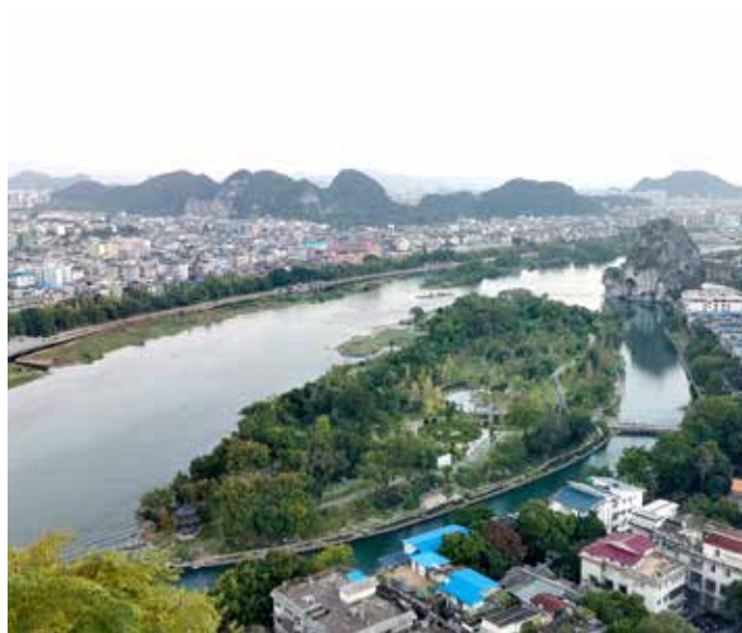
▲ 漓江上小岛伏龙洲生态修复后