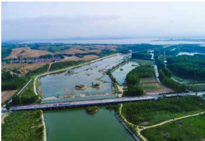
▲ 日照水库大桥 313 省道治理后

通过运用 EOD（生态环境导向的开发模式）模式，以“绿水青山就是金山银山”转化长效机制建设为核心抓手，统筹推进日照水库流域高标准严要求保护与高质量可持续发展。主要做法包括：一是突出生态优先，强化日照水库的生态安全保护。坚持规划引领，以《东港区国家生态文明建设示范区规划（2020-2025年）》为蓝本，以“三线一单”为“环境轨道”，划定“水源涵养红线、亲水活动蓝线、生态产业绿线”三条保护界线。开展系统治理，关停拆除水库上游 191 家石材加工户的 231 台大锯和禁养区内 800 余家畜禽养殖户；完成绿化 3.7 万亩，建设人工湿地 3800 亩、