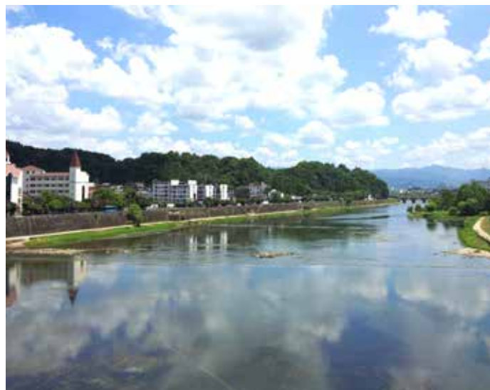
▲ 新安江横江段治理后