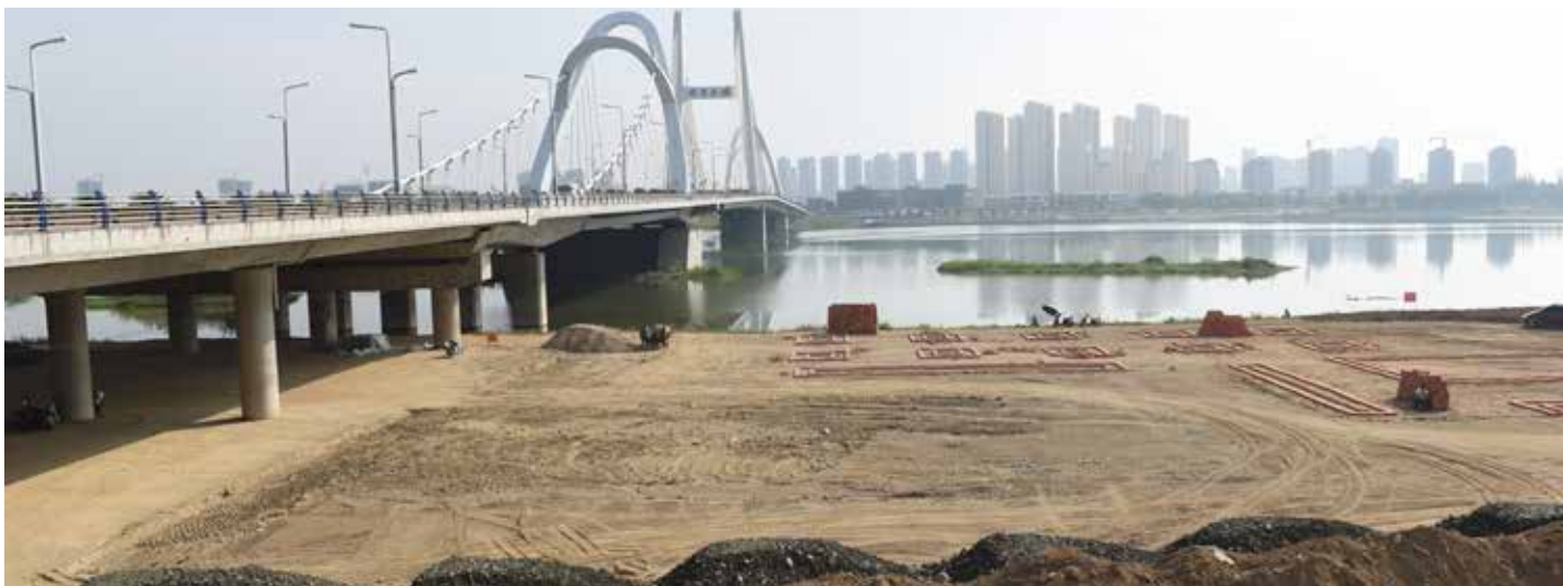
▲ 汉江（龙岗大桥段）裸露河滨带治理前

源涵养能力。 五是有效防范环境风险。 持续加大交通运输风险管控，2015 年以来累计投资 2.48 亿元，沿 316 国道新建应急池、导流槽，放置应急沙袋，安装路、桥应急闸阀，在道路临水侧加装密封护栏，加密沿线测速设备、视频监控、限速警示标牌等。建立全市 72 座尾矿库“一库一档”，实施远程视频实时监控。开展汉江流域南阳实践“一河一策一图”环境应急响应方案编制，与四川、甘肃临近地市签订联防联控协议。 六是大力推进资源转化。 实施汉江综合治理，建成的天汉湿地公园已成为汉中人水相亲、治水