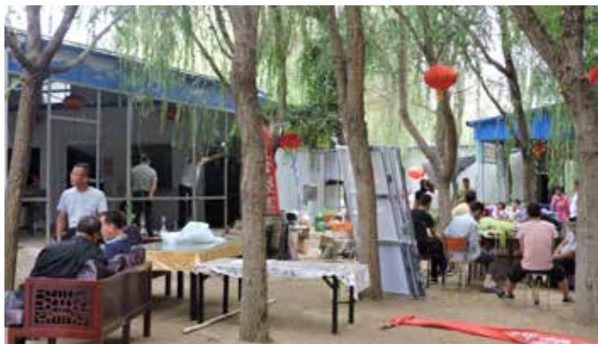
▲ “五一休闲”农家乐拆除前