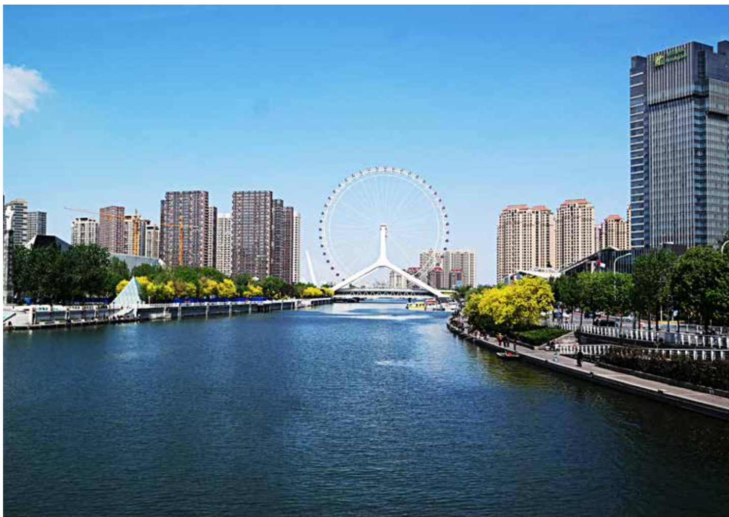
▲ 治理后海河沿岸水清、岸绿

展监督。为推动系列精细化治理手段落地实施，加强市区及流域联动，加强与市河道管理部门、上下游兄弟区紧密协作，推进“河-口-源”的全链条监管，采取污染源在线监测、精准化水体保洁、科学管控水生植物生长、全面禁渔、劝阻群众放生等系列监管措施，严防污染入河。投资 200 余万建设水质自动监测站，为研判水污染防治提供科学依据。